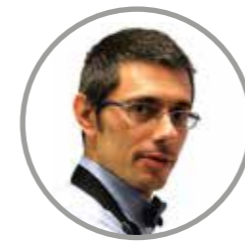
In collaborazione con DANIELE REPONI Chef in TV

Il loro gusto ricercato, dato da ingredienti biologici di prima qualità, si sposa perfettamente alla pizza più gustosa, alle nuove tendenze dello street food più raffinato e alla sempre più diffusa cultura del panino "gourmet", basata sull'attenzione ai sapori e alle materie prime di qualità, soprattutto di origine bio.